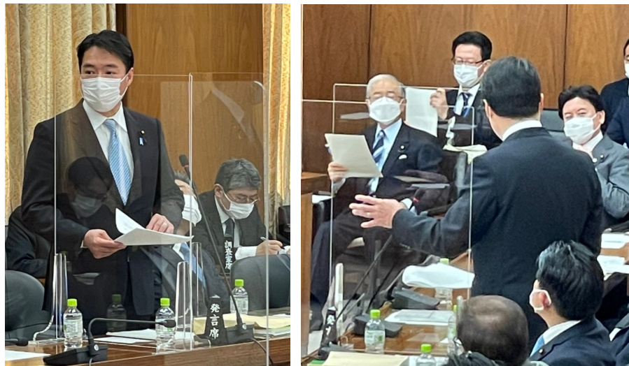
農林水産委員会での質問の様子