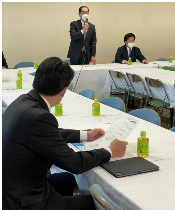
政調 国際協力調査会の様子