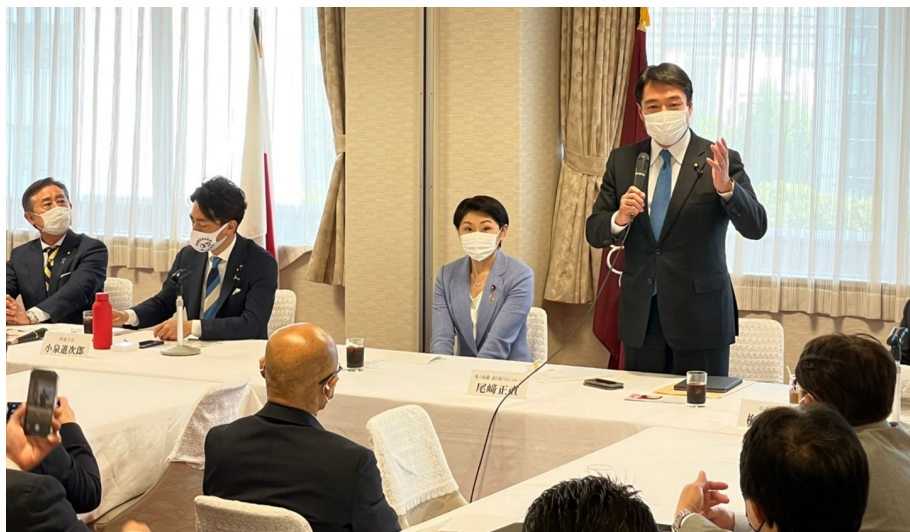
地方組織議員総局長として、かながわ自民党市町村議員協議会の皆様と懇談

組織運動本部・地方組織議員総局は、地方議員との窓口となる部署でもあります。総局長として、地方の皆様と懇談できる機会は難しいもの。高知以外の「地方」から多くを学ばせていただきます！