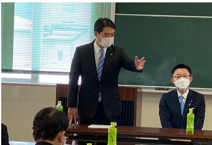
中土佐町にて中西祐介参議院議員と演説会