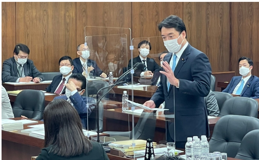
法務委員会での質問の様子