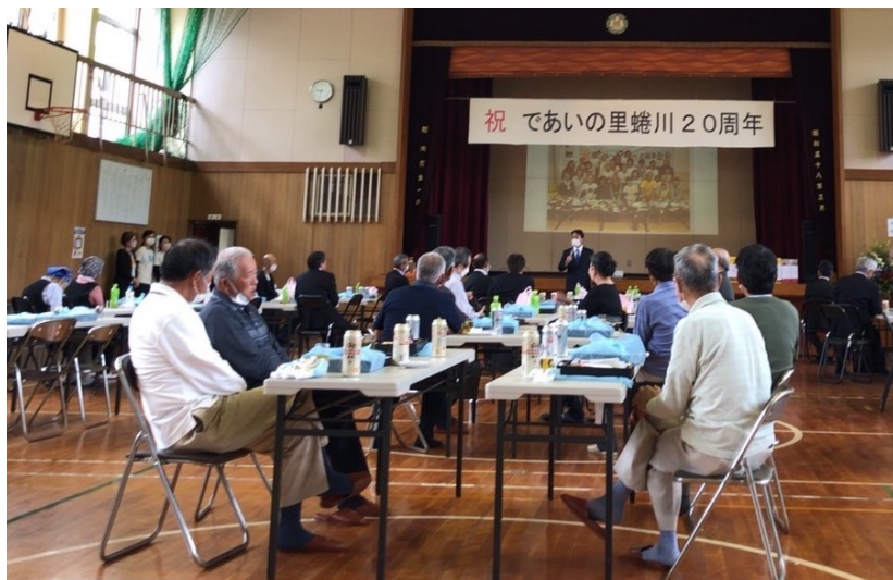
集落活動センターであいの里蜷川 20周年記念式典の様子

合わせて、日曜日(1日)には、黒潮町にもご挨拶回りに伺いました。出合いの里蜷川の20周年の行事にも参加させていただき、改めて、地域の小さな拠点の意義をかみしめたところです。お招きいただき、誠にありがとうございます!