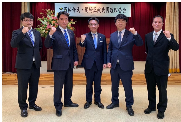
仁淀川町での演説会にて