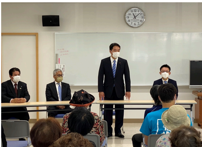
四万十町にて中西祐介参議院議員と演説会