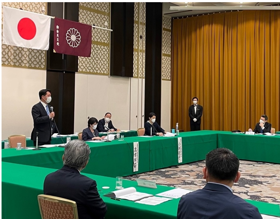
自民党・九州ブロック幹事長・政務調査会長会議の様子

県連ごとに政策面、政治面、それぞれに抱える課題は様々。しっかりと、県毎の事情を学び、今後に活かして参ります！