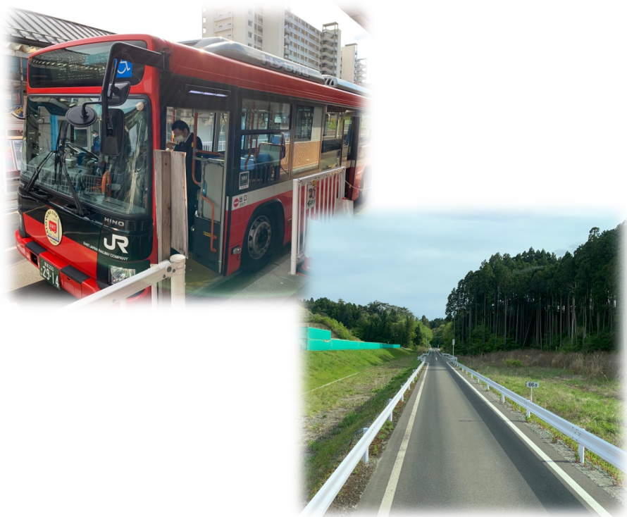
地方創生実現のための公共交通ネットワーク再構築議連現地視察にて