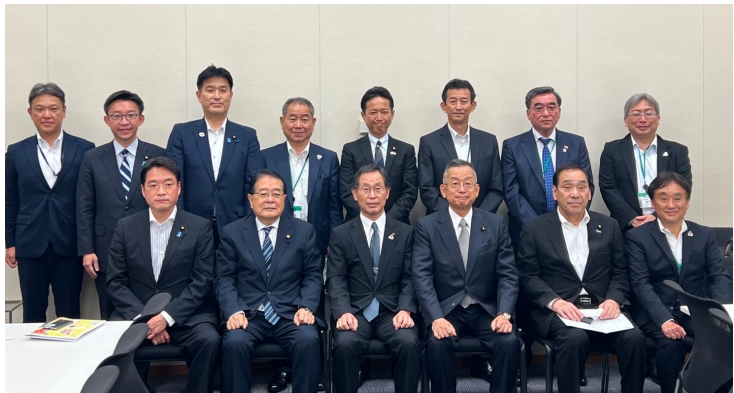
高知県選出国會議員とJAグループ高知の政策懇談会の様子

本議連の目標は、犯罪被害者への経済的支援策を抜本的に改善すること。事務局次長として、しっかりと議論に参加します。