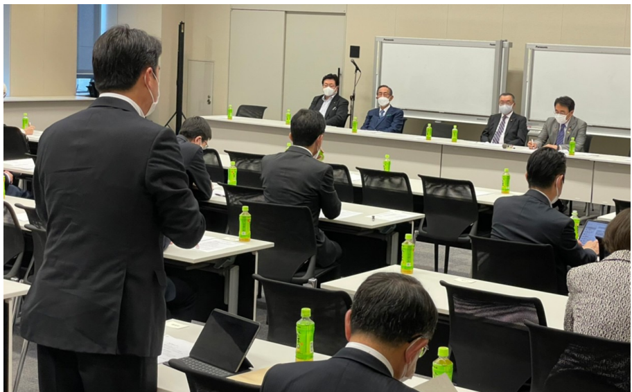
地方創生実現のための公共交通ネットワーク再構築議連総会の様子