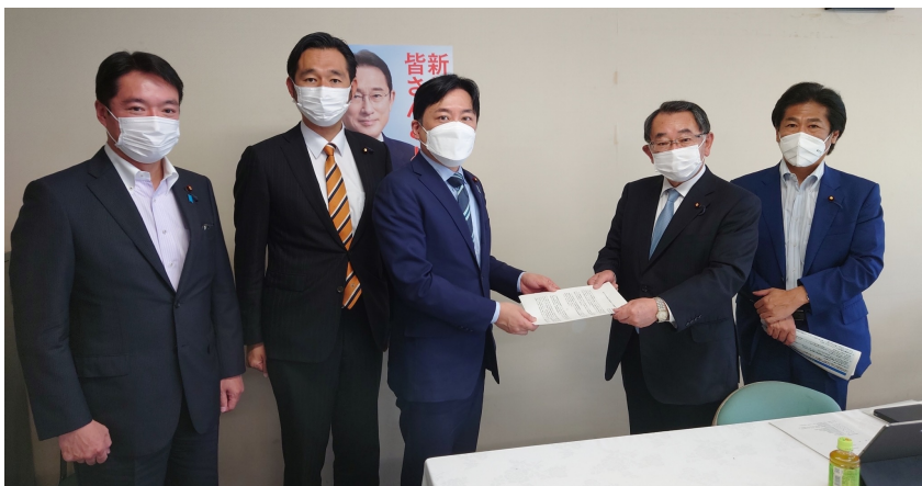
雇用問題調査会にて