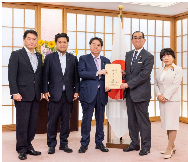
国際協力調査会 林外相への申し入れの様子