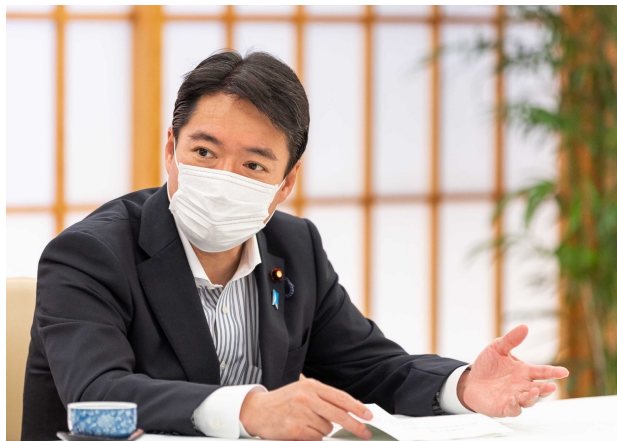
林外相に「戦略的な国際協力強化の必要性を訴える」