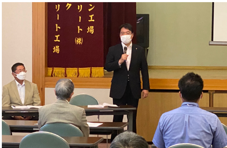
四万十市議の皆様との政策懇談の様子