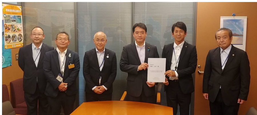
高知県防災砂防協会の皆様と懇談