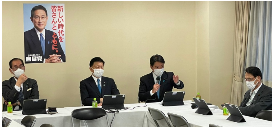
デジタル田園都市国家構想推進委員会・GIGAスクール社会実装TFにて司会を務める

GIGAスクール構想は、1人一台デジタル端末の配布によって、距離のハンディをなくし、個別最適な学びを実現しようとする構想です。その推進は、本県の大多数を占める中山間地域の教育水準の向上、ひいては、移住促進などにも繋がる可能性を持つ意義深いもの。デジタル田園都市国家構想を通じて、その更なる推進を図るべく、TFにて議論を積み重ねました。