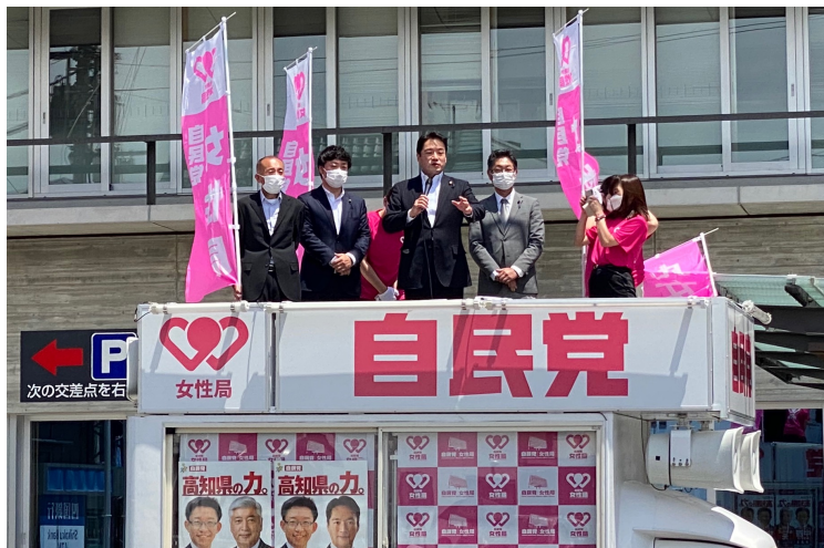
「スマイル号」から街頭演説(いの町にて)

参議院選挙も間近に迫ってきました。党勢拡大に向けて、引き続き頑張ってまいります！