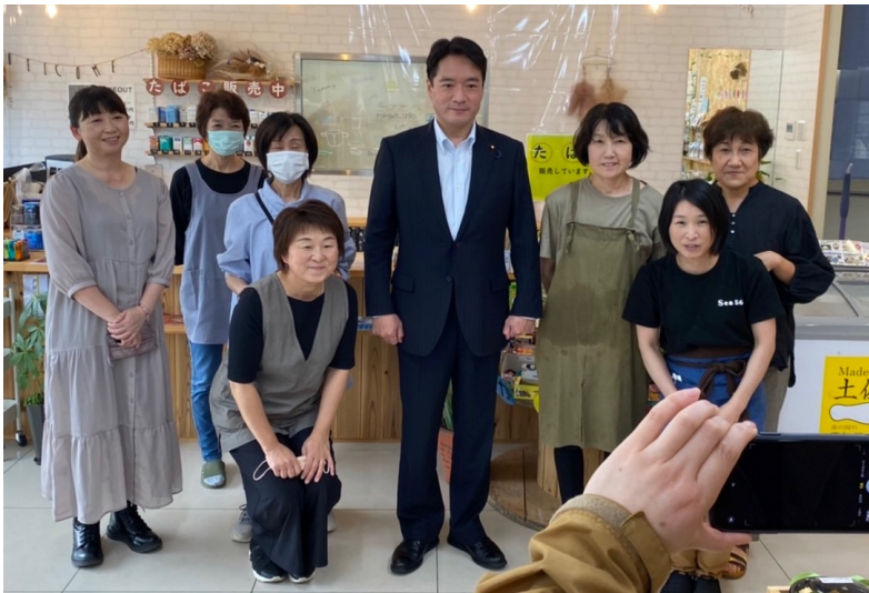
ご挨拶回りの様子①

週末10日(金)夕刻には、高知県建設業協会総会懇親会に出席。11日(土)には、黒潮町にてご挨拶回りののち、夕刻には公明党の時局講演会にてご挨拶させていただきました。12日(日)には、土佐清水市にてご挨拶回りさせていただきました。参議院選挙も間近に迫ってきました。党勢拡大に向けて、引き続き頑張ってまいります！