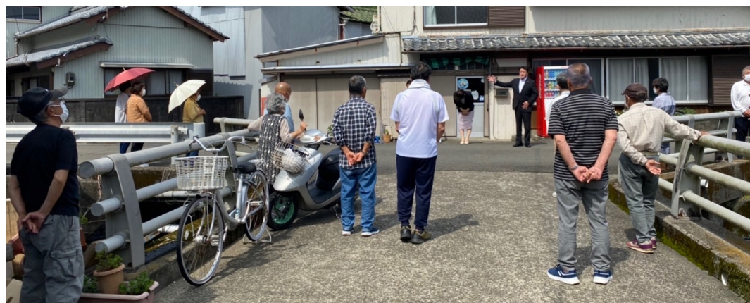
ご挨拶回りの様子③