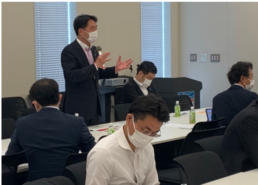
次世代ライフサイエンス・イノベーション議連設立総会(10日)の様子