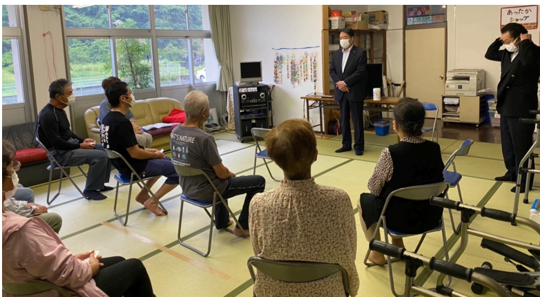
ご挨拶回りの様子②