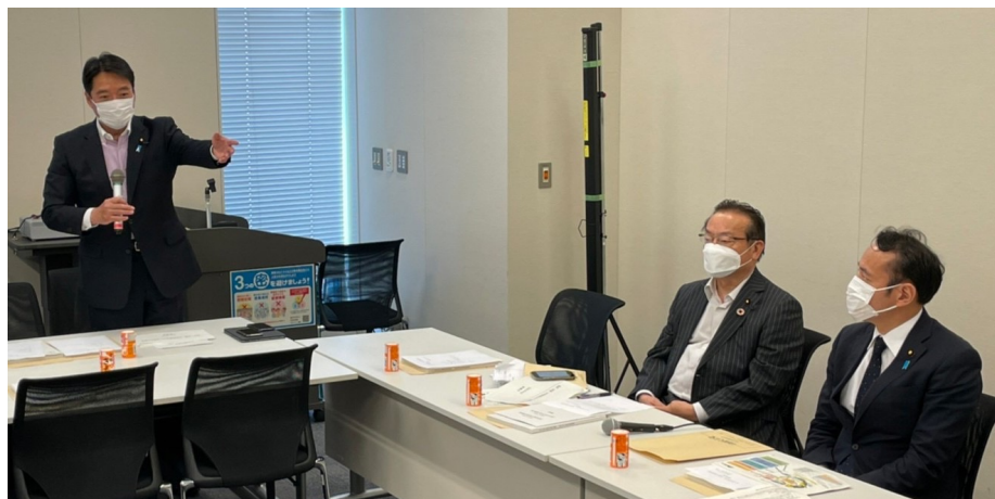
林業若手議員勉強会(10日)の様子

国土強靱化推進本部では、引き続き、関係団体からのヒアリングを精力的に実施しています。ポスト「5か年加速化計画」に向けて、検討を継続していきます！